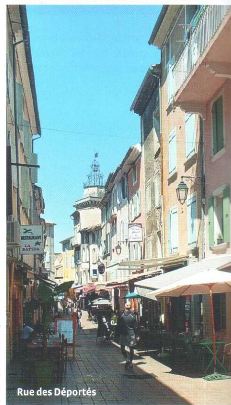
Rue des Déportés

Tegenwoordig wordt de markt in de zomermaanden uitgebreid met marktkooplui die creatieve producten verkopen, zoals sieraden, kleding, aardewerk en schilderijen. Om helemaal in Provençaalse sferen te komen vindt van mei tot en met september op zondagmorgen in de oude binnenstad een Provençaalse markt plaats.