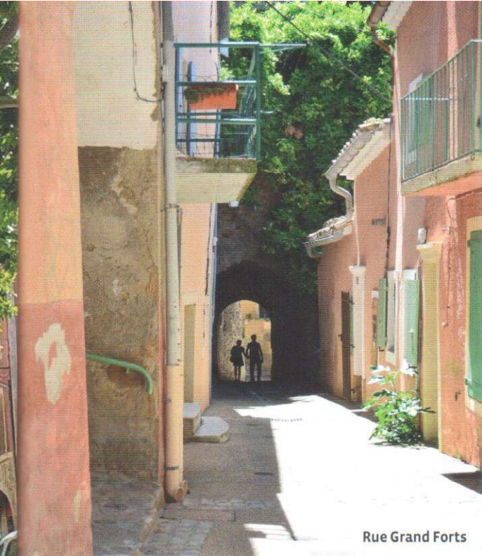
Rue Grand Forts