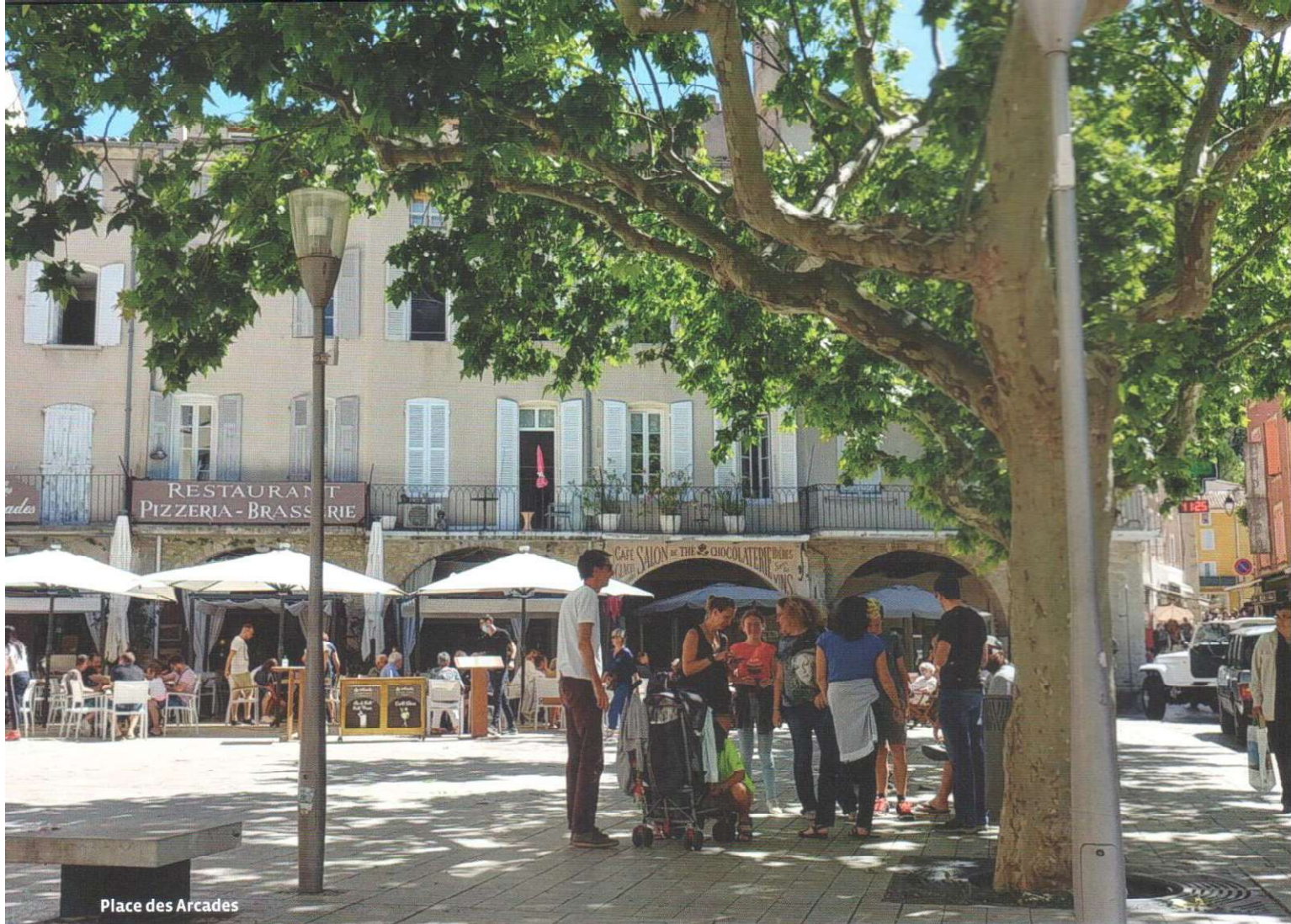
Place des Arcades

V anaf die Pont Roman, waar je kunt genieten van het zicht op de stad en op de rivier de Eygues, is het oude centrum makkelijk te bereiken. De historische binnenstad is reuze interessant voor de toerist die van authenticiteit en Zuid-Franse sfeer houdt. Er zijn geen souvenirwinkels of andere vervuilende toeristische attracties te vinden.